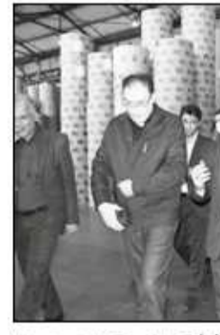
وزیر اقتصاد با اشاره به لزوم ثبات مدیریت در مجموعه شرکت صنایع چوب و کاغذ مازندران تاکید کرد تا قبل از هفته دولت تسهیلات مورد نیاز چوب و کاغذ تأمین و مدیریت شرکت ضمن پیگیری، گزارشی از روند همکاری دستگاه های مختلف را به اینجانب ارائه نماید. دکتر خاندوزی وزیر اقتصاد و دارائی بهرهمه استاندار مازندران، نمایندگان مردم ساری در مجلس شورای

اسلامی، قائم مقام مدیر عامل بانک ملی ایران، مدیر عامل هولدینگ آینده پویا، و تعدادی از مدیران ارشد استانی از مجتمع چوب و کاغذ مازندران بازدید نمودند. دکتر خاندوزی وزیر اقتصاد و دارائی ابتدا ضمن تقدیر از مدیریت و کارکنان مجموعه خاطر نشان ساخت: اعتماد وزارت آموزش و پرورش موجب گردید تا روح امید در مجموعه به جریان بیافند. وزیر اقتصاد و دارائی به اهتمام وزارت اقتصاد در ایجاد ارتباط با سایر نهادها و حل مشکلات موجود در شرکت صنایع چوب و کاغذ مازندران اشاره و افزود: هیچ اولویتی مهمتر از این نیست که به سرعت اینچرا احیاء نمائید. در این بازدید امید نیک نژاد مدیر عامل شرکت صنایع چوب و کاغذ مازندران، ضمن ارائه گزارشی اجمالی در خصوص روند فعالیت شرکت و مشکلات و معضلات موجود، از اراده مدیران و کارکنان این مجموعه جهت دستیابی به خودکفائی کاغذ خیر داد و خاطر نشان ساخت: در شرایط کنونی در تلاش هستیم تا با حمایت