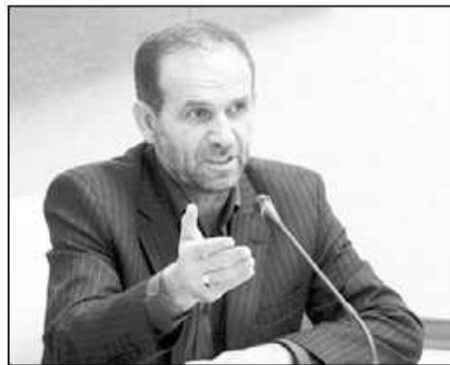
۱۴۰۱ رقم خورده و تاخیر در مدیرکل بعدی جای سوال دارد.

این فعال آموزشی با اشاره به بحث توانمندسازی معلمان در سند تحول، عنوان می‌کند: معلم باید توانمند و متعلم باشد، تکمیل و به‌یوزرسی تجهیزات مدارس، ساماندهی کلاس‌ها از باب ایجاد فضا و مسائلی از این قبیل برای آغاز سال تحصیلی جدید در انتظار توجه ویژه مراجع تصمیم‌گیر قرار دارد، مدیرکل جدید باید به این موارد توجه کند.