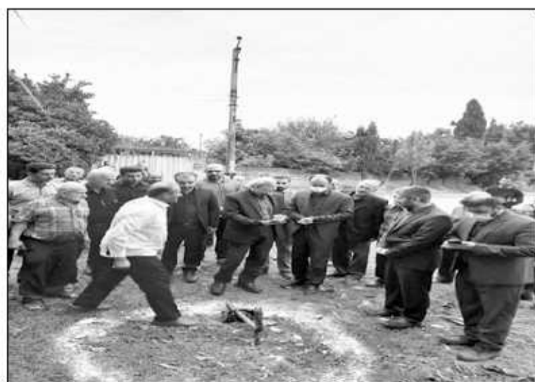
ساخت این طرح به زمین زده شد. مدیر مشارکت‌های مردمی و مازندران با بیان این‌که برای اجرای این

پروژه ۱۰ میلیارد ریال تأمین اعتبار شده است، خاطرنشان کرد: عملیات اجرایی این پروژه شامل ساخت حوضچه مکش و نصب دو دستگاه پمپ سانتریفیوژ، تابلو برق و تجهیزات برقی، خط لوله فلزی و پلی‌اتیلن و احداث ساختمان دو طبقه برای تاسیسات برقی و پمپاژ است.