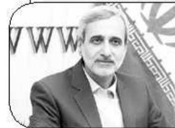
نایب رئیس کمیسیون امنیت ملی:

این کارشناس مسائل بین‌الملل عنوان کرد: ما تعهد را در مقابل تعهد می‌پذیریم به این معنی که هرگاه طرف مقابل به تعهدات خود عمل کرد، مذاکرات وین تمام شده است و در حال حاضر نیز باید طرف اروپایی باید تعهد بدهد که تمام تحریم‌ها علیه ملت ایران را لغو کند و تضمین‌های لازم را ارائه دهد تا مجدداً مانعی برای شرکت‌هایی که می‌خواهند در ایران سرمایه‌گذاری کنند یا کشورهای دیگر به دنبال انجام معاملات اقتصادی با ایران هستند، ایجاد نکند. وی تصریح کرد: اگر این اتفاق بیفتد و در آمریکا هم این اراده سیاسی ایجاد شود که تعهدات مندرج در