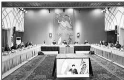
موفقیت آمیز ماهواره «خیام» در مدار، دریافت پیام، کنترل و مدیریت داده به دست متخصصان ایرانی را افتخار آمیز

سیزدهم بنا دارد عقب ماندگی‌ها در این حوزه را جبران کند و در آینده شاهد رونمایی از دستاوردهای جدیدی در این زمینه خواهیم بود که کمک شایانی به محیط زیست، اکتشافات معدنی، مدیریت مخاطرات طبیعی و پایش مرزها می‌کند. رئیس‌جمهور ضمن گرامیداشت روز خبرنگار و قدرانی از تلاش‌های آنان برای آگاهی بخشی به جامعه، بر اهمیت جهاد تبیین تأکید کرد و از همکاران دولت خواست در تعاملی سازنده و صمیمانه با اصحاب رسانه، اقدامات دولت در همه بخش‌ها را به مردم گزارش دهند و اجازه ندهند هیچ‌گونه ذهنی در افکار عمومی باقی بماند. رئیس‌جمهور تأکید کرد: دولت مردمی از همان روز اول استقرار، تمام تلاش خود را برای حل مشکلات به کار گرفته و لازم است این تلاش‌ها هنرمندانه به اطلاع مردم برسد، ضمن آنکه اگر وعده یا کاری هم بر زمین مانده، باید دلایل آن برای مردم تبیین شود.