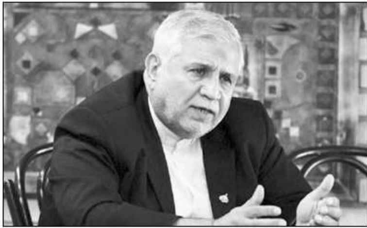
کارشناس مسائل بین‌الملل: