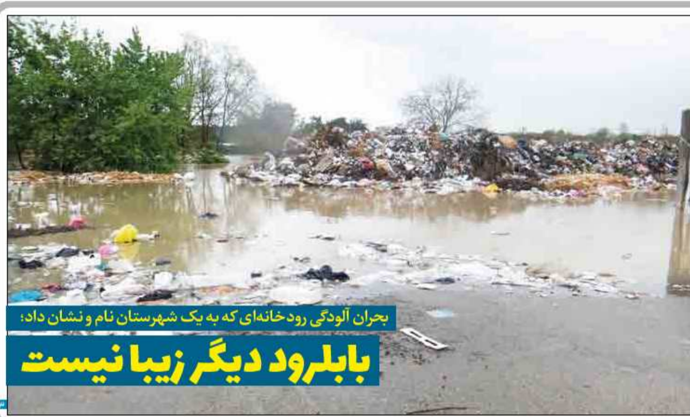
بحران آلودگی رودخانه‌ای که به یک شهرستان نام و نشان داد؛ بابرود دیگر زیبا نیست

مدیرکل راه و شهرسازی مازندران اعلام کرد: پیشرفت فیزیکی ۳۵ درصدی ۳۳ هزار خانه خودمالکی طرح نهضت ملی مسکن