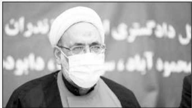
رئیس کل دادگستری استان مازندران

گفتنی است، سومین جلسه ستاد اقتصاد مقاومتی استان با حضور رئیس کل دادگستری استان و کلیه اعضای ستاد برگزار شد و ۴ واحد تولیدی در این جلسه به بیان اختلالات و مشکلات حقوقی خود پرداختند و درخصوص چگونگی رفع مشکلات آنان بحث و تبادل نظر صورت گرفت و جهت رفع موانع و سهولت در کار این واحدها، دستورات لازم از سوی رئیس ستاد اقتصاد مقاومتی استان صادر گردید.