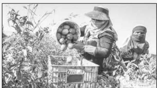
کارکنان جهاد کشاورزی شهرستان میاندورود در حال برداشت گوجه فرنگی

به گزارش مازندپنج، وی با بیان اینکه گوجه فرنگی اشتهاآور، برطرفکننده ضعف و خستگی، تقویتکننده سلسله اعصاب و همچنین قلب و دستگاه گردش خون است، گفت؛ متخصصان همواره مصرف آن را به بیماران مبتلا به دردهای مفاصل و رماتیسم و نقرس توصیه می کنند.