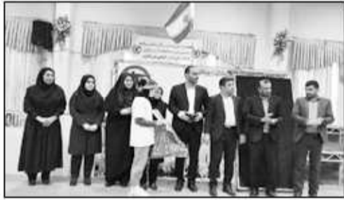
در رده سنی جوانان، فارس بر سکوی نخست ایستاد. مازندران دوم شد و چهارم‌حال بختیاری در جایگاه سوم قرار گرفت. به گزارش باشگاه خبرنگاران، فارس و مازندران در رده سنی بزرگسالان مانند رده سنی جوانان اول و دوم شدند و