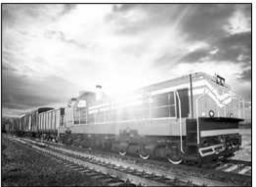
این میان شرکت راه آهن CO2Rail نیز تصمیم دارد قطارهای فعلی را برای انجام این کار تجهیز کند. واگن های مخصوص شرکت طراحی شده اند تا انرژی تولید شده از ترمز را در باتری هایی ذخیره و از سوی دیگر از جریان حرکت قطار برای اجتناب از نیاز به پرتابه تهریه استفاده کنند. جریان هوای ورودی به سیستم به یک محفظه سیلندری شکل

بزرگ جمع آوری دی اکسید کربن هدایت می شود و در آنجا یک فرایند شیمیایی، گاز مذکور را جدا و آن را در یک مخزن مایع نگهداری می کند تا بعدا خالی شود. سپس هوای پاک و بدون کربن از انتهای واگن وارد جوی می شود. CO2Rail هم اکنون با محققان همکاری می کند تا پتانسیل این فناوری را ارتقا دهد. به گفته محققان انرژی کامل ترمز قطار برای تامین برق یک روز ۲۰ خانه کافی است. پروفسور پیترا استارینگ از دانشگاه شفیلد و محقق ارشد این پژوهش می گوید: فناوری جدید نه تنها از انرژی حافظ محیط زیست مربوط به ترمز برای جمع آوری مقادیر کلانی دی اکسید کربن استفاده می کند، بلکه از سنسورهای زیادی که فرایند ادغام در شبکه ریلی جهانی فراهم می کند نیز بهره خواهد برد. این فناوری مقادیر زیادی دی اکسید کربن را با هزینه ای بسیار کمتر از روش های پیشین است و پتانسیل رسیدن به بهره روری سالانه ۰.۴۵ گیگاتن تا سال ۲۰۳۰ میلادی، ۲.۹ گیگاتن تا سال ۲۰۵۰ و ۷.۸ گیگاتن تا سال ۲۰۷۵ را دارد.