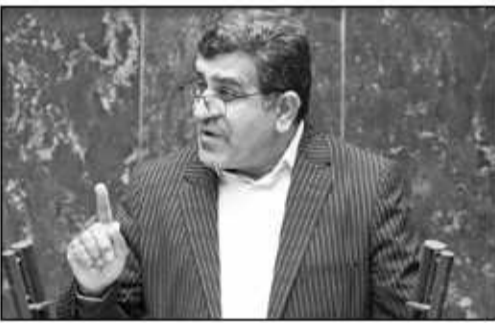
نماینده مردم ساری در مجلس شورای اسلامی بر نقش پررنگ جهاد دانشگاهی در مطالعات توسعه مشاغل خانگی در مازندران تاکید کرد.

وی با بیان اینکه جهاد دانشگاهی ارتباط خوبی با دانشگاه، مراکز علمی، نخبگان و جامعه هدف در قالب طرح‌های توسعه‌یافته دارد اظهار کرد: جهاد دانشگاهی در کشور پیشرفت‌های خوبی را در زمینه نانو و زیربخش‌های هسته‌ای و همچنین در حوزه‌های مختلف چنین‌شناسی و ژنتیک داشته است. نماینده مردم ساری در مجلس شورای اسلامی افزود: در حوزه‌های کارآفرینی و اشتغال‌زایی و استفاده از ظرفیت‌های اشتغال و توسعه