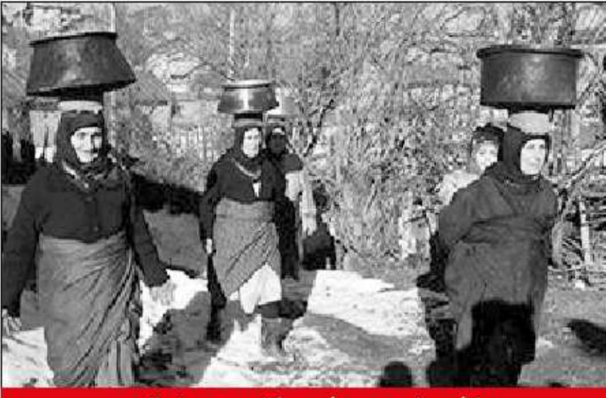
بخش هزار جریب بهشهر