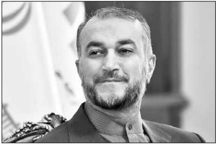
را شاهد بودیم.