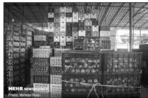
انجام شد ولی هنوز کشاورزان از دولت طلب دارند.

وی ادامه داد: تولیدکنندگان باید به دولت اعتماد کنند و قرار بود حداکثر ۱۰ درصد مانده طلب باغداران تا ۲۵ تیرماه پرداخت شود که اکنون وارد مردادماه شدیم و هنوز پرداخت نشده است. شعبانی با بیان اینکه برای تولید سال آینده نیاز به نقدینگی داریم، گفت: باغداران در حال پرداخت سود به بانک هستند و این سبب می شود که پیش بانک و دیگران بد حساب شوند. مدیرعامل اتحادیه باغداران مآزندان میزبان تولید مرکبات در استان را بیش از ۲۰۷ میلیون تن ذکر کرد.