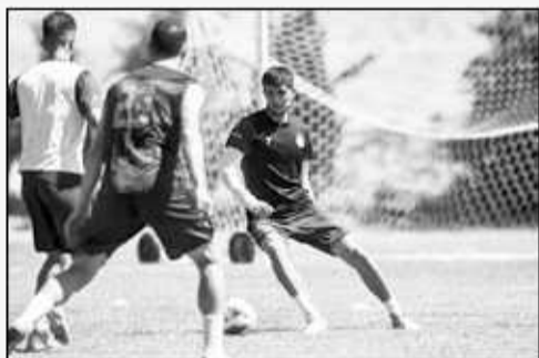
بازیکنی که مغضوب سرمربی پیشین استقلال می بود، امروز به یکی از بازیکنان محبوب سرمربی جدید بدل شده است.