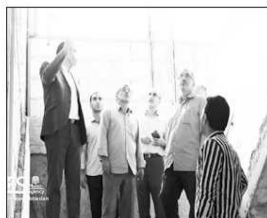
بررسی مشکلات استانداردسازی و تجهیزات مدارس جویبار و لاریم.

سرپرست اداره کل نوسازی مدارس استان مازندران گفت: در بازدید از مدارس، مشکلات آنها در زمینه استانداردسازی و تجهیزات آموزشی مورد بررسی قرار گرفت و مقرر گردید با توجه به اقلام مورد نیاز و موجودی انبار بخشی از کمبودها جبران و سایر آنها نیز تا پایان سال تامین گردد. وی افزود: پروژه‌های آموزشی در حال احداث با پیشرفت قابل قبول در حال انجام می‌باشد و امیدواریم با تامین به موقع اعتبارات ملی و استانی بتوانیم این پروژه‌ها را در کمترین زمان ممکن به پایان برسانیم.