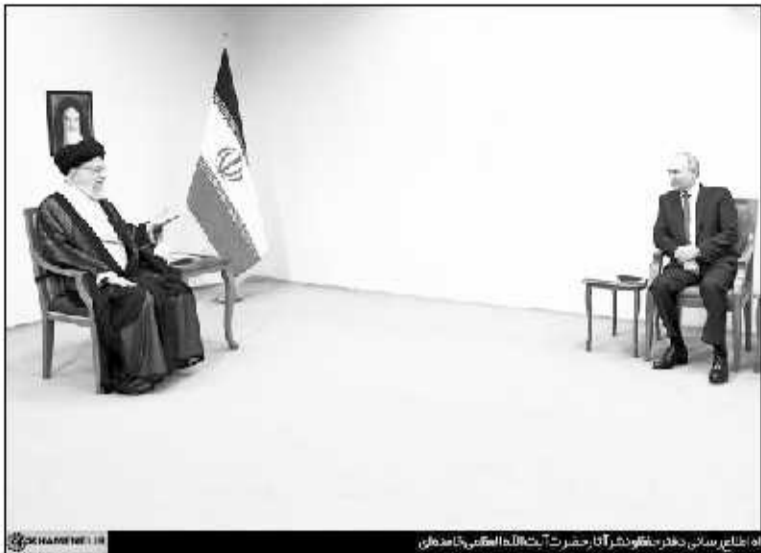
ایمان پوتین، رئیس جمهور روسیه در دیدار با رهبر معظم انقلاب اسلامی

رئیس جمهور روسیه با برشمردن عوامل و ریشه های اختلاقات روسیه و اوکراین، بویژه اقدامات تحریک آمیز غرب و آمریکا در سال های اخیر از جمله کودتا در اوکراین و همچنین سیاست گسترش ناتو با وجود تعهدات قبلی آنها مبنی بر پرهیز از هرگونه پیشروی به سمت روسیه، بعضی از کشورهای اروپایی گفتند ما مخالف عضویت اوکراین در ناتو بودیم اما تحت فشار آمریکا با آن موافقت کردیم که این نشان دهنده فقدان حاکمیت و استقلال آنها است.