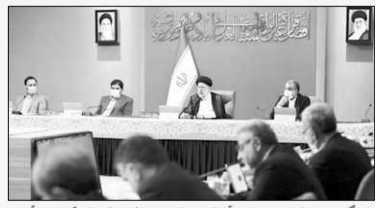
رئیس جمهور در دیدار با اعضای هیئت مدیره سازمان اسناد و کتابخانه ملی

مردم و پاسخ به سوالات افکار عمومی، خطاب به مسئولان این دستگاه ها گفت: لازم است در تبیین اقدامات و عملکرد مجموعه تحت مدیریت خود فعال تر و جدی تر عمل کنید. این حق مردم است که از اقدامات و روندها در دستگاه های اجرایی اطلاع کامل داشته باشند.