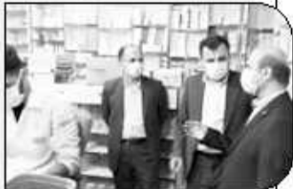
تیم های پایش معاونت غذا و دارو دانشگاه علوم پزشکی مازندران در راستای اجرای طرح دارویار از داروخانه های مازندران بازدید کردند.