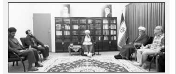
رئیس دفتر نظارت و بازرسی انتخابات شورای نگهبان در مازندران عنوان کرد: مشارکت حداکثری و انتخاب اصلح راهبردهای رهبری انقلاب

نماینده ولی فقیه در مازندران با عنوان اینکه شورای نگهبان هر سال و روز در بخش نظارت و بررسی صلاحیت‌ها قوتی‌تر عمل می‌کند، تصریح کرد: شورای نگهبان باید بر اساس مدارک و مستندات عمل کند.