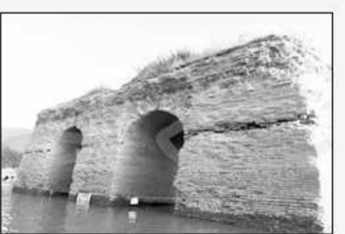
ضلع شمالی چهار طاقی آجری کاخ تابستانه شاه عباس که بیشتر از سایر نقاط در معرض امواج آب و باد است در معرض تخریب قرار گرفت. سرپرست پایگاه میراث جهانی باغ عباس آباد با بیان اینکه خسارت به یک لایه از چهار طاقی آجری عباس آباد عمیق نیست، گفت: این خسارت در ضلع شمالی این چهارطاقی که بیشتر از سایر نقاط در معرض امواج آب و باد است اتفاق افتاده و بخشی از یک لایه آجر به