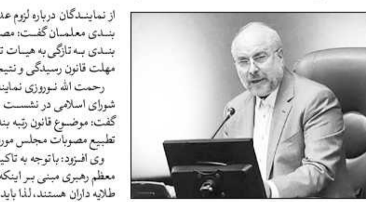
رئیس مجلس شورای اسلامی در واکنش به اخطار یکی