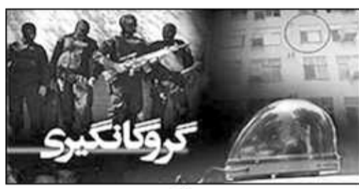
استفاده از سلاح سرد (تفنگ بادی) مادرش را در داخل یکی از اتاق‌ها منزل مسکونی مجبوس و به گروگان گرفته

است. به گفته جانشین انتظامی شهرستان ساری با حضور به موقع کارشناسان و مشاوران پلیس و مذاکره با فرد گروگانگیر، سرانجام این فرد خود را تسلیم پلیس کرد و مادر مجبوس در اتاق آزاد شد. او می‌گوید: در تحقیقات تکمیلی پلیس از خانواده گروگانگیر مشخص شد، متهم به گروگانگیری (پسر خانواده) که دارای مشکلات روحی و روانی است، اقدام به این عمل خطرناک کرده که پس از دستگیری با تشکیل پرونده به مرجع قضائی معرفی شد.