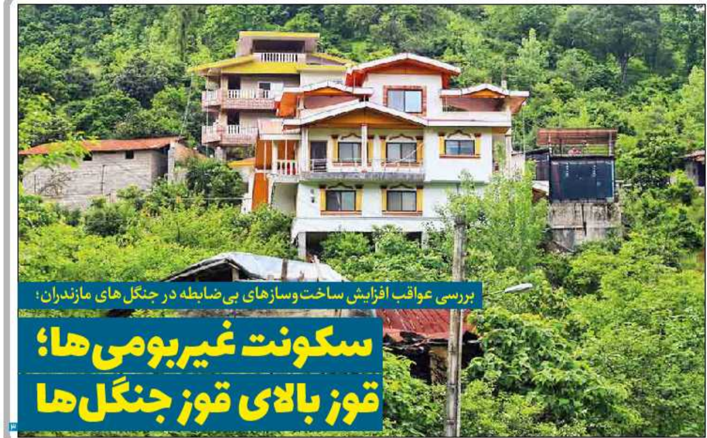
بررسی عواقب افزایش ساخت وسازهای بی ضابطه در جنگل های سازنداران؛