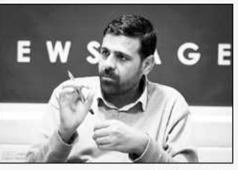
عضو هیئت رئیسه مجلس ؛

آمريکايي سر عقل آمده باشد. نادری اظهار کرد: از آنجا که مذاکرات در دوچه، به جمع‌بندی و درخواست طرف‌های گفتگوی ایران آغاز شده است، این خوش‌بینی وجود دارد که اتفاق جدیدی در راستای دستیابی به نتیجه محقق شود، البته نتیجه‌ای که به نفع مردم ایران باشد.