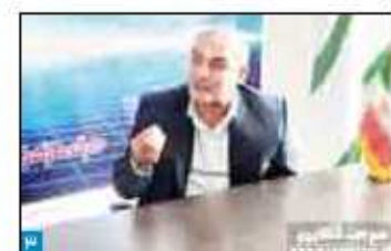
معاون بهداشتی دانشگاه علوم پزشکی مازندران تاکید کرد؛