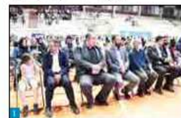
سرپرست اداره کل پست مازندران تاکید کرد؛