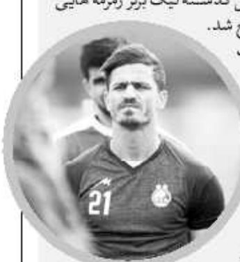
مهدی طارمی، مهاجم تیم ملی فوتبال ایران

صعود یک رای عجیب در فاصله دو روز مانده به هفته پایانی لیگ دسته سه، سرنوشت صعود تیم‌ها را کاملاً تغییر داد. به گزارش 'ورزش سه'، در آستانه برگزاری بازی‌های هفته پایانی لیگ دسته سوم فوتبال ایران، صدور رای که به هفته دوم مربوط می‌شود، سرنوشت صعود را تحت تأثیر قرار داد. رای صادره باعث شد تا مردان پاشا ۳۳ امتیازی شده و هیجان هفته پایانی با قطعی شدن صعود این تیم از این برود. بیشترین ضرر را از این رای، تیم آکادمی کیا متحمل شد که پیش از صدور آن، با ۲۸ امتیاز، شانس زیادی برای صعود داشت ولی حالا دیگر چنین شانسی را ندارد.