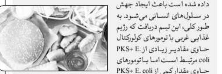
این تیم به دنبال سویه های باکتریایی حامل ژنتیک مجزا معروف به پلی کتید سنتاز (PKS) بود. PKS آنزیمی را رمزگذاری می کند که نشان داده شده است باعث ایجاد جهش در سلول های انسانی می شود. به طور کلی، این تیم دریافت که رژیم غذایی غربی با تومورهای کولورکتال حاوی مقادیر زیادی از E. coli PKS+ مرتبط است اما با تومورهای حاوی مقدار کمی از E. coli PKS+ مرتبط نیست.

تحقیقات جدید نشان می دهد رژیم غذایی غربی سرشار از گوشت قرمز و فرآوری شده، قند و دانه های تصفیه شده / کربوهیدرات، با خطر بیشتر سرطان روده بزرگ از طریق میکروبیوم های روده مرتبط است. به گزارش خبرنگار مهر به نقل از هلث لاین، محققان بیمارستان زنان بریگام بوستون، داده های بیش از ۱۳۴ هزار شرکت کننده در ایالات متحده را بررسی کردند. این تیم الگوهای رژیم غذایی و همچنین DNA را از سویه های Escherichia coli که در بیش از ۱۰۰۰ تومور کولورکتال (سرطان روده بزرگ) یافت می شود، تجزیه و تحلیل کرد.