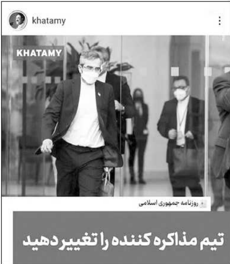
روزنامه جمهوری اسلامی

فردای آن روز یک روزنامه اصلاح طلب در سرمقاله خود نوشت که دزنگ جایز نیست و هر چه زودتر باید زیر قرارداد جدید را امضا کرد. این جملات از سوی نویسنده آن یادداشت در