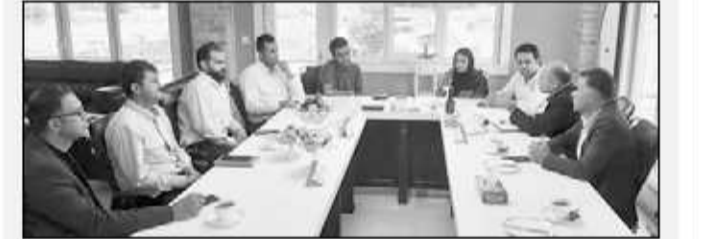
مدیرکل پست استان مازندران با مدیران واحدهای تولیدی در شهرک صنعتی بشل سوادکوه شمالی در جلسه‌ای نشست کرد.

گفتنی است، مدیرکل پست استان مازندران با حضور در شهرک صنعتی بشل سوادکوه شمالی، از واحدهای تولیدی موتور بشل، گروه صنعتی درنا پلت و تکساز تابلو، در نشستی با صنعتگران این شهرک به بررسی چگونگی بهره مندی واحدهای تولیدی از خدمات متنوع و نوین پست پرداخت.