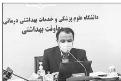
رو به افزایش است، ادامه داد: این نشان می دهد که زمان زیادی از آخرین دوز واکسن تزریقی زائران استان گذشته است، از این رو زائران تقاضا داریم برای سلامتی

معاون بهداشتی علوم پزشکی مازندران با بیان اینکه طبق مصوبه ستاد کرونا استفاده از ماسک در محیط روبراز الزامی نیست، اظهار داشت: ماسک زدن در جلسات و محیط های سروشیده الزامی است اما متأسفانه رعایت نمی شود. وی با اشاره به اتخاذ تدابیر بهداشتی برای کنکور گفت: نظارت لازم برای رعایت شیوه نامه های بهداشتی در محل های برپایی کنکور در دست اقدام است.