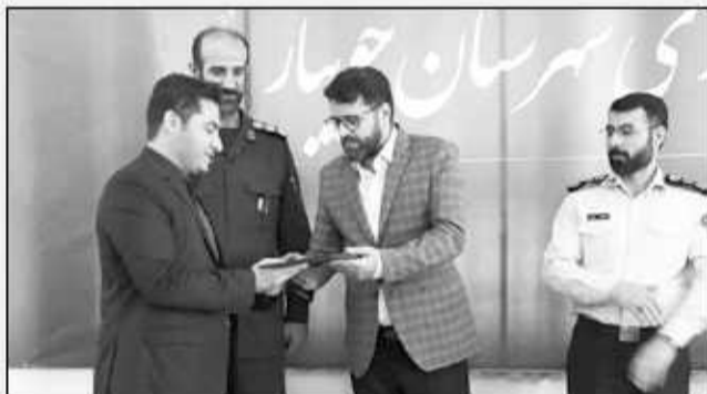
با حکم استاندار مازندران: