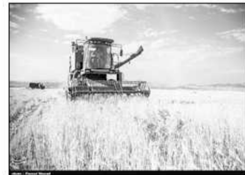
سازمان جهاد کشاورزی مازندران با تولید کنندگان وارد گفت و گو می شوند و آموزش های لازم را می دهند.

اینکه هدف اصلی کارشناسان، در این مسائل این است عملکرد تولید را افزایش دهیم، همچنین به مراتب می تواند در تولید کشور و تولید استان مازندران اثر گذار باشد که در سال های اخیر با آغاز این طرح شاهد افزایش در واحد سطح بودیم. به گزارش تسنیم، عنایتی تصریح کرد: برنامه آتی جهاد کشاورزی این است که این سطح را در حوزه های مختلف تولید به مراتب هم گسترش بدهیم و هم بتوانیم از خدمات بیشتری در در حوزه های مباحث فنی و خدمات تولید که جز مکانیزه کردن اراضی ما است و مدیریت در مزرعه را در عملکرد گندم زارها افزایش بدهیم. وی خاطرنشان کرد: استان مازندران ۵۰ هزار هکتار سطح زیر کشت گندم دارد که از این اراضی حدود ۱۵۰ هزار تن گندم تولید می شود که برداشت این محصول استراتژیکی در استان آغاز شده است.