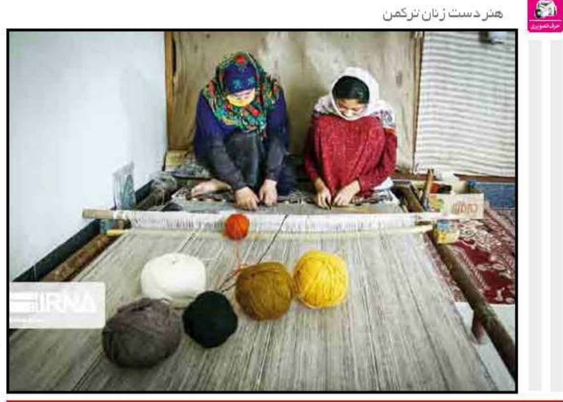
هنر دست زنان ترکمن