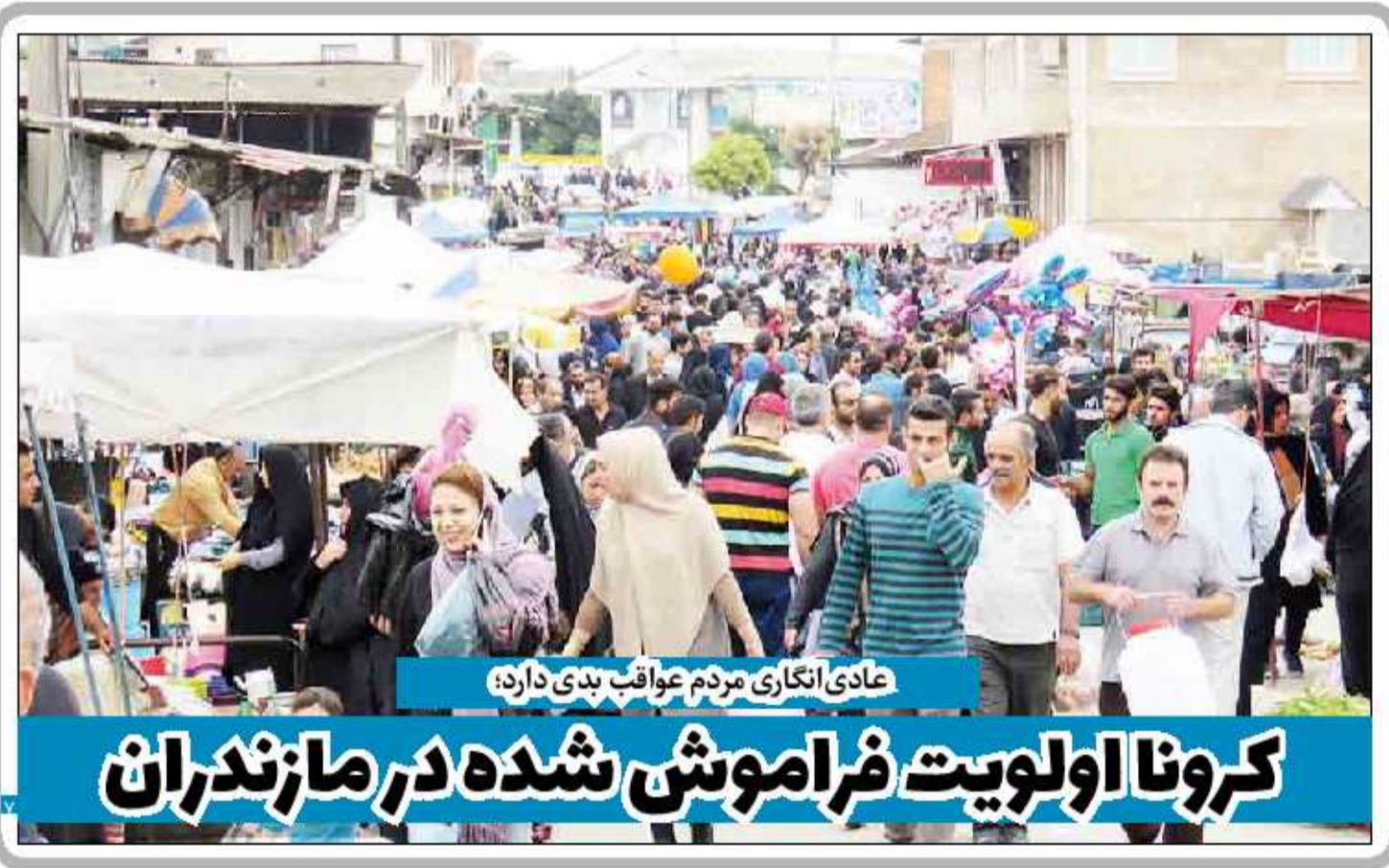
عادی انگاری مردم عواقب بدی دارد؛