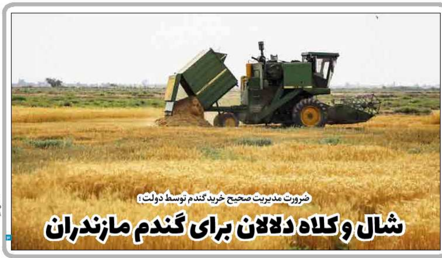
ضرورت مدیریت صحیح خرید گندم توسط دولت؛