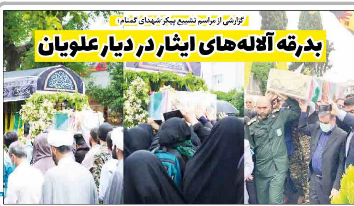
گزارشی از مراسم تشییع پیکر شهیدای گمنام؛