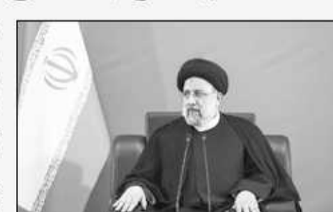
رئیس جمهور جمهوری اسلامی ایران

زمینه تحقق خط اعتباری تأمین منابع صندوق ملی مسکن، واریز درآمدهای مالیاتی حوزه زمین و مسکن به این صندوق، واگذاری زمین‌های مستعد اجرای طرح از سوی دستگاه‌ها به وزارت راه و شهرسازی و استانداردها، تسریع در صدور مجوزهای لازم از جمله از سوی شهرداری‌ها، تمهید خدمات شهری و زیربنایی و هرگونه تأخیر و عقب‌ماندگی دیگر در کوتاه‌ترین زمان باید رفع شود.