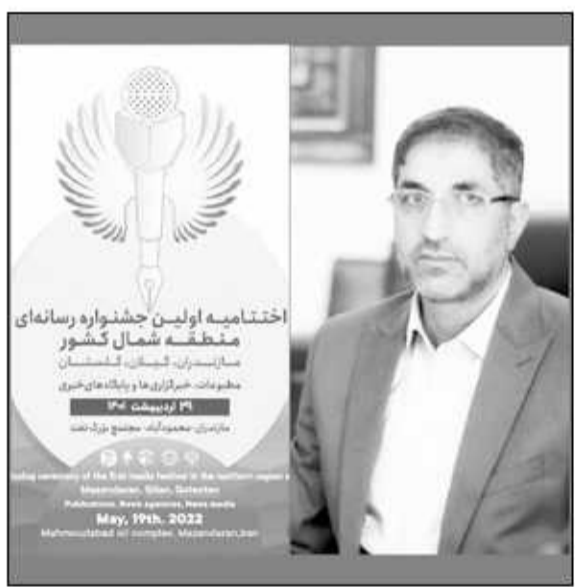
سرپرست اداره کل استاندارد مازندران خبر داد: